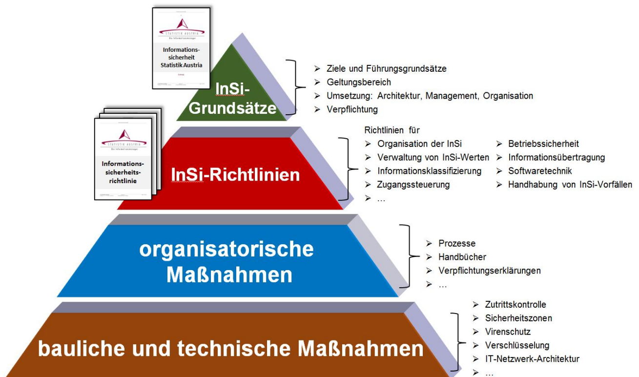
Abbildung 1: InSi-Architektur

Die InSi-Architektur legt die Hierarchie von Grundsätzen, Richtlinien und Maßnahmen fest – siehe Abbildung 1: